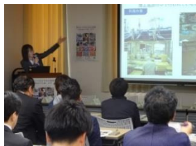
雇用支援セミナー