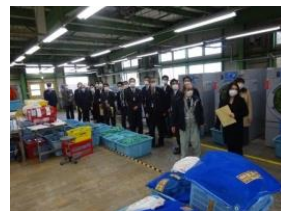
刑務所・少年院 スタディツアー